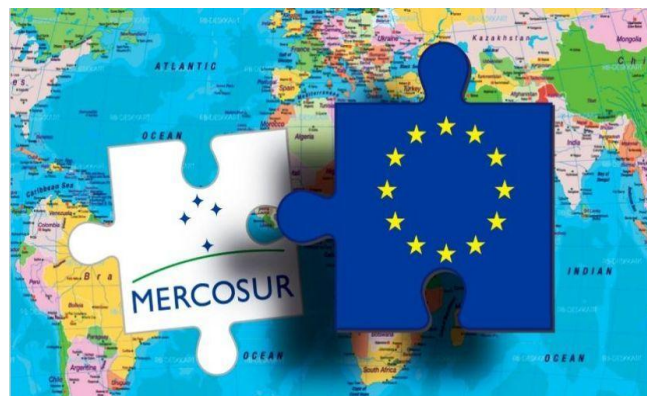
ILUSTRACIÓN: El Cronista

COMPETITIVIDAD, como condición ineludible para poder dar viabilidad a nuestros negocios.