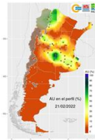
PORCENTAJE DE AGUA ÚTIL EN EL PERFIL

Luego de las lluvias de la segunda parte de enero y las tormentas dispersas a principios de febrero, sobre el día 19 llegaron buenas lluvias en la zona central y norte de la cuenca oeste, con registros entre 20 y 40 milímetros, caídos como para entrar bien en el suelo. Aunque en esta época la humedad dura poco en la capa superficial y sigue siendo clave el nivel de reserva en el perfil, que en nuestra cuenca ya está muy ajustado (no sobra nada). Para FEB-MAR-ABR en el oeste de Bs As, el SMN pronostica lluvias inferiores a las normales y temperaturas superiores a las normales.