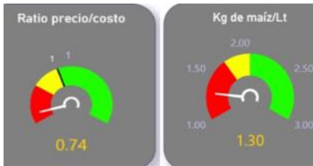
Gráficos: Consultora Economía Láctea

Está complicado el comienzo del 2021. Pero si bien es difícil, parece posible remontarlo: en el mundo las alteradas rel. de precios por el alza de los granos, se están corrigiendo vía incremento en los precios de la leche. Aquí, lácteos y leche han quedado muy atrás de la inflación, y hay margen para achicar la brecha. Esto es bueno para mejorar la capacidad de pago de la industria, y que eso se traslade a una mejora en los precios al productor.