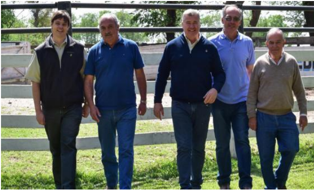
Productores tamberos CREA Villa María